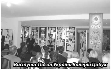
Виступає Посол України Валерій Цибух