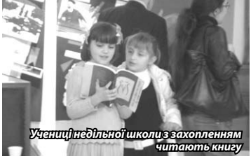
Учениці недільної школи з захопленням читають книгу