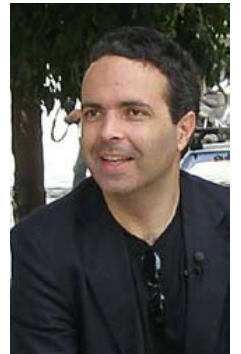
Γράφει ο Δρ. Νίκος Λυγέρος

ο σύγχρονος χορός και η κίνηση χορού. Όλα αυτά τα γνωστικά αντικείμενα έρχονται να εφοδιάσουν τη γνώμη των παιδιών αλλά και τα κλασικά μαθήματα με μία βιωματική προσέγγιση, όπου η τέχνη είναι και εργαλείο και έργο. Ποιος μπορεί να ξεχάσει τα λεγόμενα του Φέδωρ Δοστοεβσκι, όταν μας αποκαλύπτει ότι η ομορφιά θα σώσει τον κόσμο; Η νοημοσύνη μας πρέπει να διαχειριστεί τη μη πληρότητα των γνώσεων. Η επιστήμη μαθαίνει από την ομορφιά για να αγγίξει την αλήθεια. Τα μαθηματικά, ως μουσική της σιωπής, παραμένουν τεχνική για όσους δεν έχουν γνωρίσει την τέχνη. Κατά συνέπεια, τα Καλλιτεχνικά Σχολεία δεν είναι μόνο μια ειδική