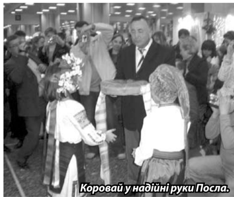
Коровай у надійні руки Посла.

режкою і хрестиком, плахти, сувеніри, обереги – це все складало образ України. Вдягнені в українські строї дівчата привертали увагу відвідувачів. В суботу в приміщенні HELEXPO відбувся невеличкий концерт за участю дітей Посольства України та української недільної школи при Товаристві «Українсько-грецька думка», під керівництвом заступника Культурно-інформаційного центру при посольстві Людмили Тараненко. Звичайно, подивитися на виступ маленьких українців завітали Посол України в Греції Валерій Цибух з дружиною.