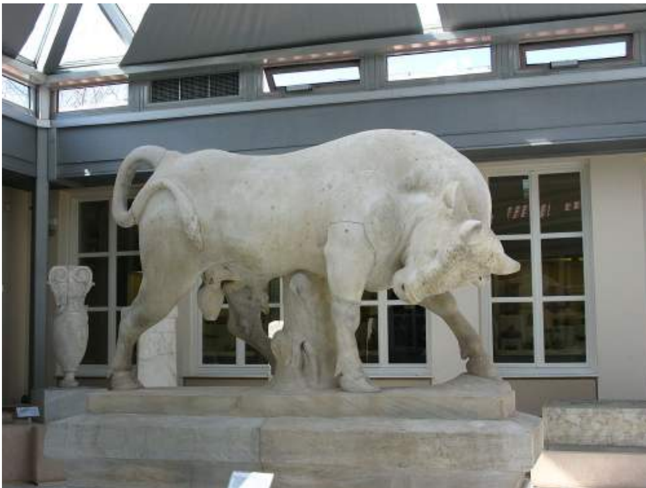
Ο ταύρος στο ταφικό μνημείο του Διονυσίου από τον Δήμο του Κολλυτού