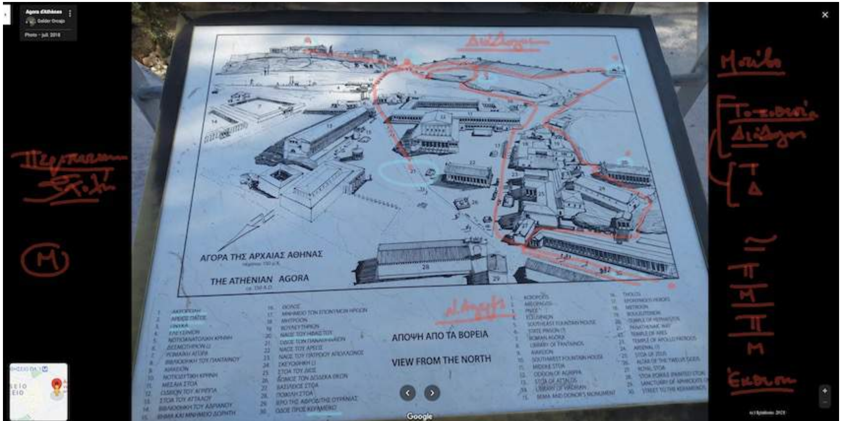
ε-Μάθημα Π: Σοκρατικός Περίπατος. (Dessin)