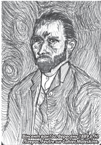
Вінсент ван Гог. Вересень 1889 р. Н. Лігерос. Feuille sur Caillefroid Moleskine

З 11-го червня і протягом місяця в Палеонтологічному та історичному музеї Птолемаїди триватиме художня виставка відомого грецького вченого, добре відомого читачам українських сторінок, Нікоса Лігероса. Цього разу експонатами виставки є не лише олія, але й пастилі - роботи, що є продовженням книги "Le monde de Vincent", яка вийшла минулого року французькою мовою, а також досліджень "Le Sud de Van Gogh". Вивчаючи життя та творчість голландського художника Нікос Лігерос намагається показати своїм сучасникам багатогранну особистість ван Гога не тільки як художника, але як талановитого письменника, мовника, перекладача, священника і, найосновніше, Вінсента - Людину. Хто зміг побувати на вернісажі виставки, що подорожує регіонами Греції і зараз на цілий місяць "осіла" за ініціативою мерів в Птолемаїді, і мав можливість послухати лекцію