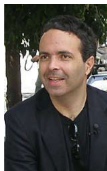
Γράφει ο Δρ. Νίκος Λυγερός www.lygeros.org

ιερά εξέταση. Και η καταδίκη είναι σίγουρη. Διότι δεν υπάρχει σωστή απάντηση. Κάθε απάντηση είναι και μία νέα κριτική που ασκείται πάνω στο παιδί με ειδικές ανάγκες που με αυτόν τον τρόπο καταλαβαίνει την έννοια της ασκητικής. Περνάει από μία εξέταση που θα καθορίσει την πορεία της ζωής του μέσα στην κοινωνία. Έτσι καταλαβαίνει και τη σημασία της εκπαίδευσης. Του λείπει, βέβαια, η αξία της. Διότι δεν ξέρει το ποσό που παίρνει κάθε εξεταστής για να τον καταδικάσει. Το παιδί δεν μαθαίνει από μόνο του τι είναι ο Χριστός, κα-