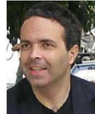
Γράφει ο Δρ. Νίκος Λυγερός

που μπορεί να ερμηνευτεί ως ο γρηγορότερος τρόπος για ν' αλλάξουμε μία μεθοδολογία. Κατά συνέπεια, το λάθος μπορεί ως γνωστικό εργαλείο να έχει χαρακτηριστικά που μπορεί να χρησιμοποιηθούν για την εύρεση της λύσης. Με άλλα λόγια, το γενικό αποτέλεσμα μπορεί να είναι αρχικά λανθασμένο, αλλά να έχει ενδιάμεσο σωστό αποτέλεσμα. Μπορεί η τεχνική να μην είναι ορθολογική αλλά να ανοίγει τον δρόμο, όπως με το περίφημο παράδειγμα του Euler. Το λάθος μπορεί να ανατρέψει ένα κλειστό ερευνητικό πλαίσιο που εγκλωβίζει τη σκέψη. Με αυτόν τον τρόπο