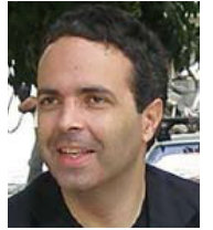
Γράφει ο Δρ. Νίκος Λυγερός

είναι: γενοκτονώ, άρα υπάρχω. Με αυτούς που σκέφτονται με αυτόν τον τρόπο έχουμε να κάνουμε στον αγώνα των γενοκτονιών. Δεν φοβούνται μόνο για την ποινικοποίηση και τις επιπτώσεις της, αλλά για την ίδια τους την ύπαρξη, διότι αγγίζουμε τα θεμέλια του κράτους και για αυτό είναι τόσο φανατικοί εναντίον των γενοκτονημένων.