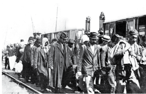
Οι Ουκρανοί δεν πέθαναν

Οι γενοκτονίες ως εγκλήματα κατά της ανθρωπότητας απαιτούν μια οργάνωση για να υλοποιήσουν μια συστηματική καταστροφή, καθώς το όρισε ο Raphael Lemkin με την επινόησή του. Αυτός ο δομικός χαρακτηρισμός, που αποτελεί από μόνος του μια στρατηγική ένδειξη, δεν χρησιμοποιείται επαρκώς από τους μαχητές της ειρήνης, που παλεύουν για την αναγνώριση των γενοκτονιών. Το Σύνδρομο της Στοκκόλμης στον ψυχολογικό τομέα, η αδιαφορία της κοινωνίας κι η αναποτελεσματικότητα του εθελοντισμού συμβάλλουν στη μη στρατηγική αντιμετώπιση των γενοκτονιών. Επιπλέον, ο γλωσσολογικός εκφυλισμός δεν διευκολύνει τον αγώνα. Στην πραγματικότητα, η έλλειψη ειδικού λεξιλογίου αποτελεί στρατηγικό λάθος, ενώ η επινόηση της λέξης γενοκτονία από τον Lemkin έδειχνε το δρόμο, που πρέπει να ακολουθηθεί. Οι μεμονωμένες προσπάθειες βοηθούν όχι μόνο τους γενοκτόνους αλλά και τους γενοκτόνους της μνήμης. Τα θύματα δεν υπάρχουν πια, οι επιζήσαντες δεν είναι οργανωμένοι κι οι δίκαιοι είναι σπάνιοι. Ενώ το αντίπαλο καθεστώς σε κάθε περίπτωση οργανώνεται ήδη από την τελική φάση της γενοκτονίας, καθώς ορίζεται από τον Stanton. Ως επιζήσαντες και δίκαιοι έχουμε την τάση να χρησιμοποιούμε ένα συμβατικό λεξιλόγιο, δίχως να αντιληφθούμε ότι αυτό συμβάλλει στον αγώνα των γενοκτονιών, για να κρύψουν την αλήθεια. Το διεθνές νομικό πλαίσιο είναι ξεκάθαρο: