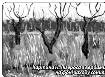
Картина Н. Лігероса з вербами на фоні заходу сонця.