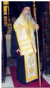
ΣΕΒΑΣΜΙΩΤΑΤΟΣ ΜΗΤΡΟΠΟΛΙΤΗΣ ΑΡΤΗΣ κ.κ. ΙΓΝΑΤΙΟΣ