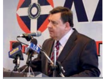
ΠΡΟΕΔΡΟΣ ΤΟΥ ΛΑ.Ο.Σ. κ. ΓΙΩΡΓΟΣ ΚΑΡΑΤΖΑΦΕΡΗΣ