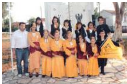
ΠΟΝΤΙΑΚΟΣ ΣΥΛΛΟΓΟΣ ΒΙΓΛΑΣ «ΟΙ ΠΡΟΣΦΥΓΕΣ»

Προς τον κόλπο του Αμβρακικού 17 χιλιόμετρα από την πόλη της Άρτας βρίσκεται το χωριό Βίγλα. Στο χωριό το 1957 έφεραν από τα μέρη της Ρωσίας ορισμένες οικογένειες προσφύγων. Εκείνη την εποχή η ζωή στο χωριό ήταν άθλια, το χωριό μας ήταν πρόσφατα αποστραγγισμένο και δεν υπήρχε φως και νερό. Στη μέση του χωριού μας κτίστηκαν τα δύο πρώτα σπίτια και μετά άλλα 50 που μας τα δώσανε με κλήρο. Μας έκτισαν Δημοτικό Σχολείο και Παιδικό Σταθμό, το τότε «Σπίτι Παιδιού» από Ολλανδούς Επιστήμονες. Οι παππούδες μας το 1914-15 με τη γενοκτονία των Ποντίων, έφυγαν από τη Τουρκία (Τραπεζούντα - Κερασούντα - Σαμψούντα) και εγκαταστάθηκαν στον Καύκασο της Ρωσίας, στα παράλια της Μαύρης Θάλασσας, στις πόλεις ΣΟΧΟΥΜΙ-ΓΑΓΚΡΑ-ΤΟΤΣΙ. Το 1914 ο Στάλιν εκτόπισε όλους τους Πόντιους από τον Καύκασο στο Καζακστάν και από το Καζακστάν, σε συνεργασία με τον Ο.Η.Ε., μας εγκατέστησαν στην άγονη περιοχή της Άρτας, στο χωριό Βίγλα. Όταν επιβιώσαμε και στηριχθήκαμε στα