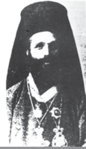
ΜΗΤΡΟΠΟΛΙΤΗΣ ΦΩΤΙΟΣ ΚΑΛΠΙΔΗΣ

Ο εκλεκτός αυτός ποιμενάρχης γεννήθηκε στο Τσαγκράκ της Κερασούντας το 1862 και μετά τις προκαταρκτικές του σπουδές στη γενέτειρά του φοιτά στο Ημιγυμνάσιο Κερασούντας και κατόπιν στην Θεολογική Σχολή της Χάλκης, από όπου αποφοιτά με άριστα ως διδάκτωρ της Θεολογίας. Το 1890 χειροτονείται ιεροδιάκονος και διορίζεται διευθυντής των σχολών της Κερασούντας ενώ το 1897 γίνεται αρχιγραμματέας της Ιεράς Συνόδου, χειροτονείται πρεσβύτερος και γίνεται μέλος της συντακτικής επιτροπής του επίσημου οργάνου του Οικουμενικού Πατριαρχείου «Εκκλησιαστική Αλήθεια». Στις 19 Μαΐου του 1902 χειροτονείται από τον Πατριάρχη Ιωακείμ Μητροπολίτη Κορυτσάς και Πρεμετής. Στην Κορυτσά καταφθάνει στις 7 Ιουλίου και γίνεται δεκτός από τα πλήθη των χριστιανών της ελληνικής κοινότητας με μεγάλη χαρά, αρχίζοντας αμέσως το σωτήριο έργο του εναντίον της ξένης προπαγάνδας (αυστριακής, ιταλικής, ρουμανικής και αλβανικής), που προσπαθεί να προσηλυτίσει τους Έλληνες της περιοχής με κάθε μέσο. Ταυτόχρονα μεριμνά και για τα σχολεία της υπαίθρου, εισχωρώντας