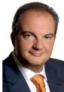
ΠΡΟΕΔΡΟΣ ΤΗΣ ΝΕΑΣ ΔΗΜΟΚΡΑΤΙΑΣ κ. ΚΩΣΤΑΣ ΚΑΡΑΜΑΝΛΗΣ

Σε μία ιδιαίτερα κρίσιμη συγκυρία για την προώθηση των εθνικών δικαίων, οι Πόντιοι Έλληνες αποδεικνύουν με συνέπεια την προσήλωσή τους στις μακράιωνες αξίες και τα ιδανικά του ελληνισμού, τιμώντας στην πράξη τις θυσίες και τους αγώνες των ηρώων προγόνων μας.